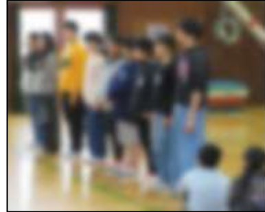
やまびこ音楽朝会(1/27)