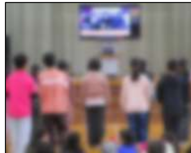
ピンクシャツデー(2/20)